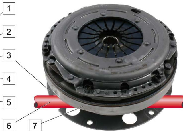
Ilustr. 2: Sprzęgło, dwumasowe koło zamachowe (7) i wał napędowy (6)