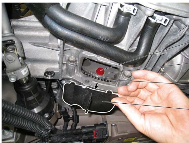
Ilustr. 1: Zdemontować osłonę (5)