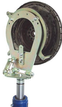
Rys. 2: Adapter do DKZ Blitz Rotary nr art. 3745430